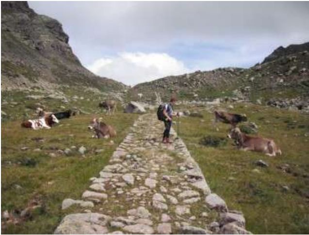
Chiedo indicazioni alle mucche