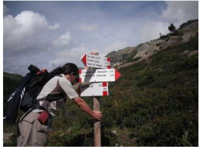
in3wrr dopo aver letto "passo Manghen, altre 3 ore"!!!