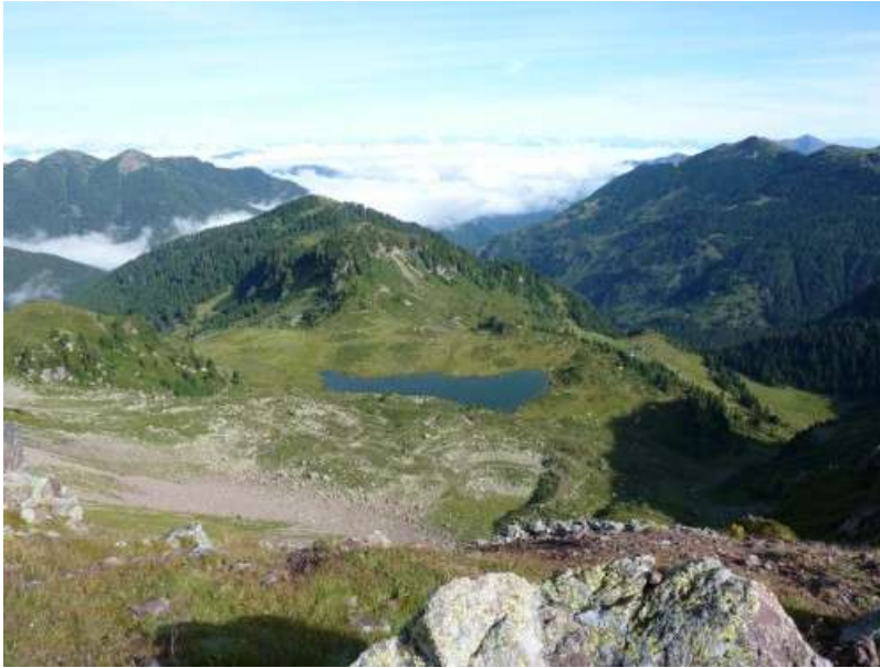
Lago delle buse

si scende di quota e dai 2300m costanti si arriva a 2080m. Alla nostra destra la cima delle Buse l'ascensione non è conosciuta ,quindi a “panza”,si nota una leggera traccia a zig zag ,che però presto sparisce,non arrivo