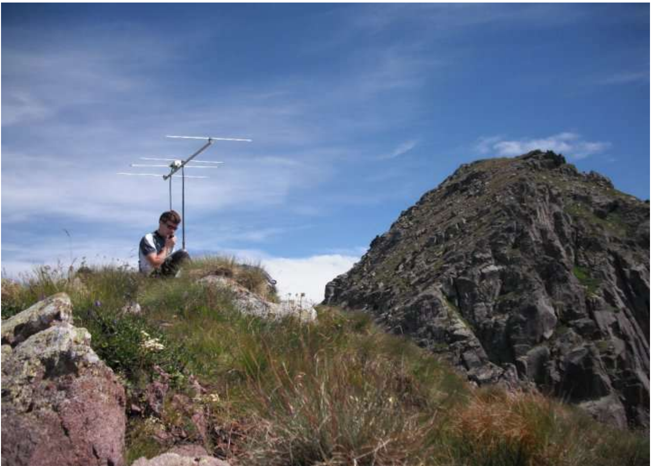
in3tlj e a destra la cima delle Buse

sulla cima ma accanto (2480m)tempo 3h25m,la cima è a 2574m,obbiettivo primario è completare in giornata un giro ad anello fino alla forcella Valsorda,e ritorno ,installo il rig. composto da 4 ele. (dk7zb),ft817,